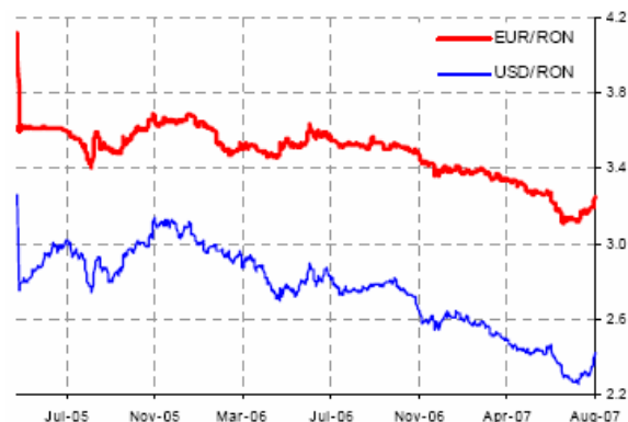
Banca Națională a României, ratele de schimb

În august leu s-a depreciat cu mult mai mult decât monedele din statele vecine. Au existat, de asemenea, zvonuri că BNR a intervenit pe piața FX pentru a susține leul care se depreciază.